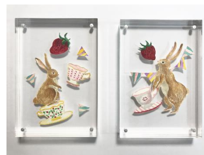
▲ 原画 (一部抜粋)