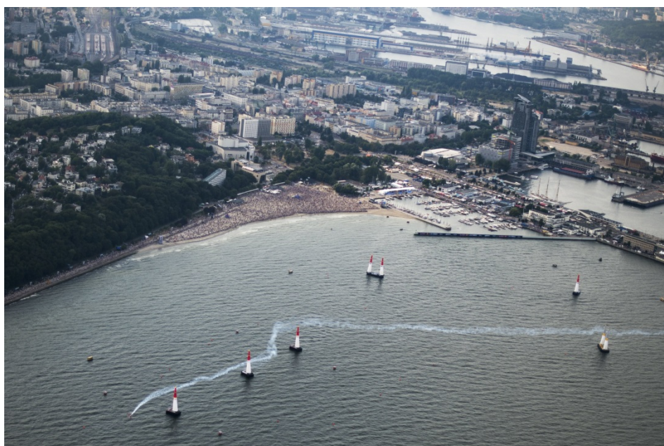
2014 年ポーランド大会より