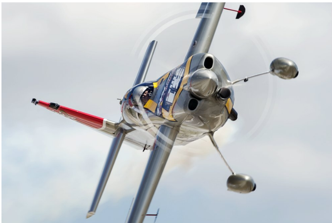
室屋義秀操る Edge540 V2 (アメリカ・ダラス大会)