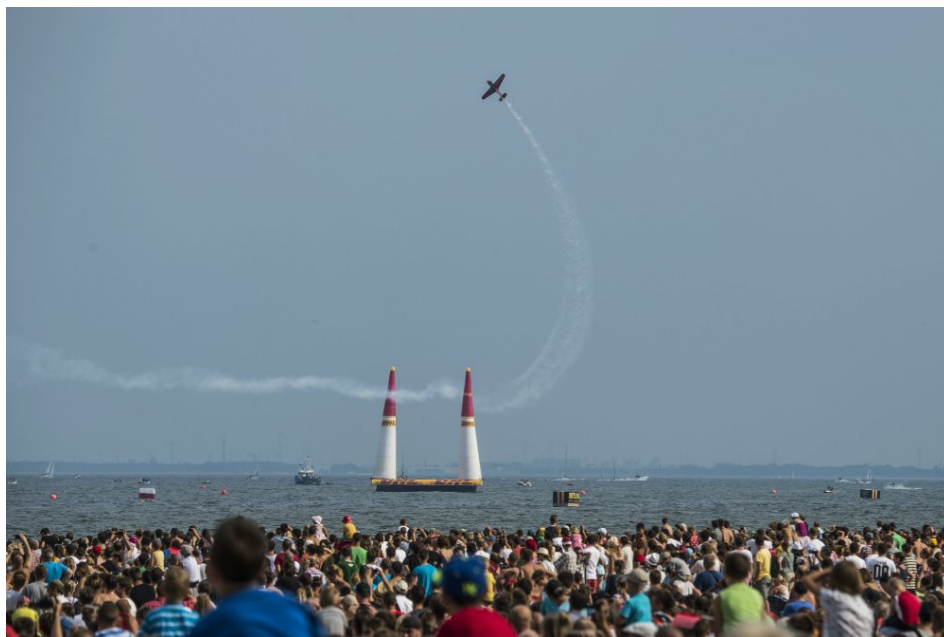
2014 年ポーランド大会より

登録方法とクレジット、ダウンロード方法は http://j.mp/RBCPUserGuide2014 をご覧下さい