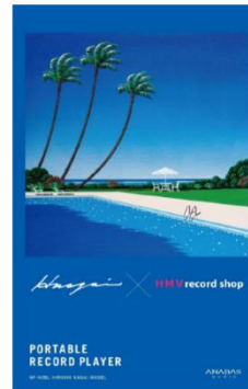
※外装スリーブイメージ